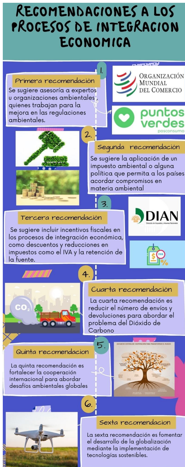
Figura 3. Recomendaciones a los procesos de integración económica en Colombia.

Elaboración propia. Fuente: IT Digital Media Group (2021).