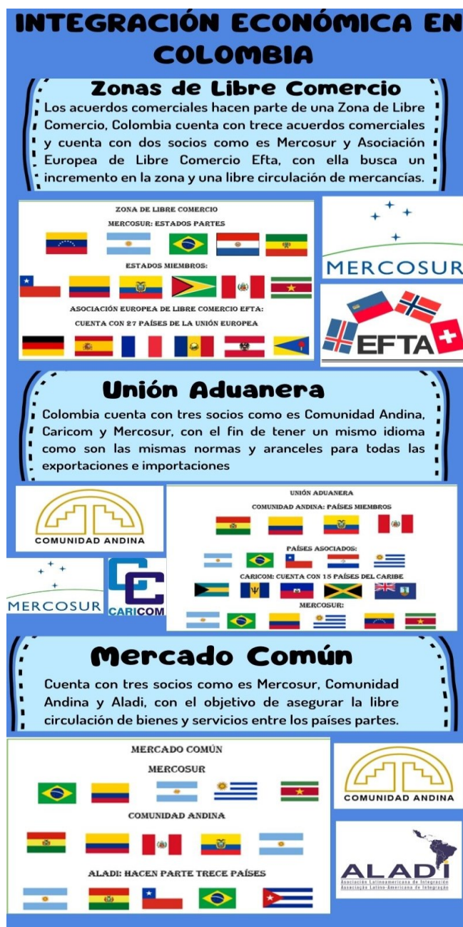
Figura 2. Procesos de Integración Económica en Colombia