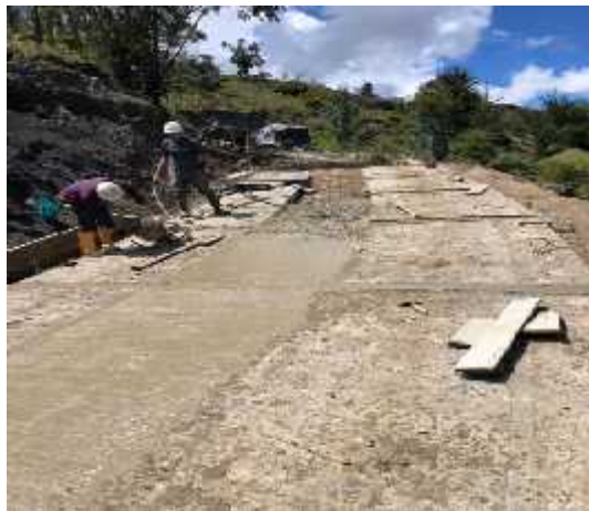
DESCRIPCION: Visita a obra