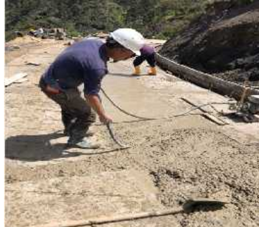
DESCRIPCION: Visita a obra

OBSERVACIONES: Se realiza vista de obra construcción de gaviones y placa huella se realiza labores de vigilancia y el control tecnico de las actividades de la ejecucion del contrato en el municipio de jerico boyaca: