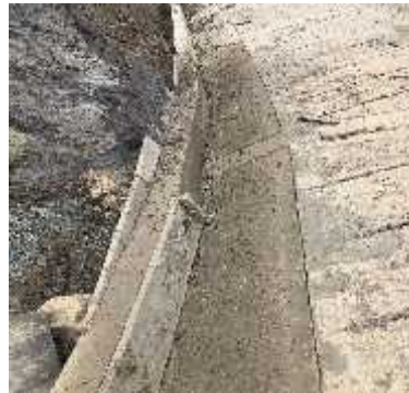
ILUSTRACION: Ejecución cunetas y bordillos

OBSERVACIONES: Se realiza vista de obra de placa huella en la vereda del juncal, y realizamos labores de vigilancia y el control tecnico de las actividades de la ejecucion del contrato en el municipio de jerico boyaca: