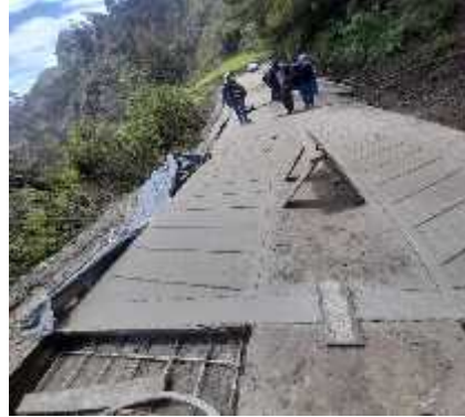
DESCRIPCION: Visita a obra