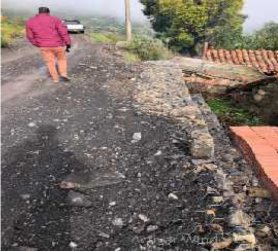
DESCRIPCION: Visita a obra