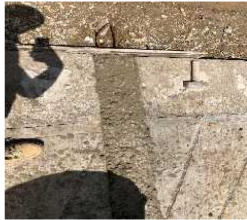
DESCRIPCION: Visita a obra