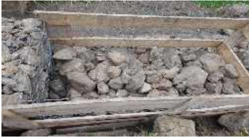
DESCRIPCION: Construccion de gaviones