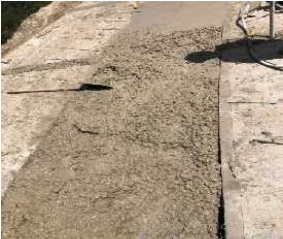
DESCRIPCION: Visita a obra