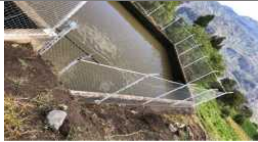
DESCRIPCION: Cerramiento en malla eslabonada cal 10 mm (incluye tubo agua negra de 2" y ángulo 1"x1"x3/16") h=1.8