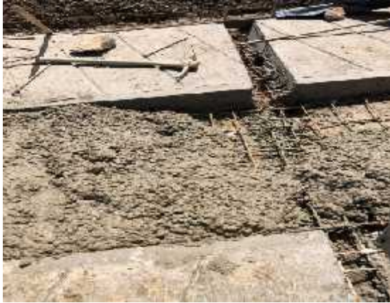
DESCRIPCION: Visita a obra