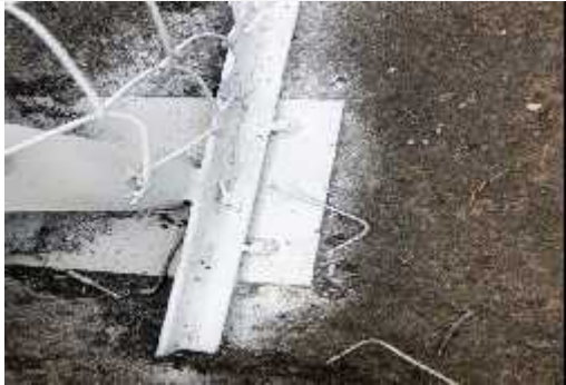
DESCRIPCION: Pernos de anclaje para concreto de 3/8 x 3 incluye tuercas y arandelas.