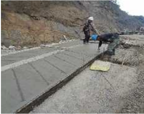
DESCRIPCION: Visita a obra