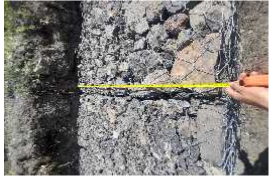
ILUSTRACION: Construccion de gaviones

OBSERVACIONES: Se realiza vista de obra construccion de gaviones que se esta desarrollando en la vereda el cocubal en el municipio de jerico boyaca: