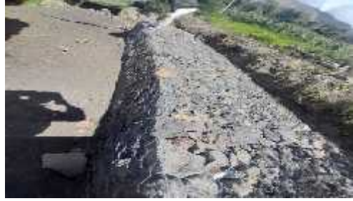
DESCRIPCION: Construccion de gaviones