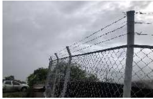
DESCRIPCION: Suministro e instalación de alambre

OBSERVACIONES: Se realiza vista de obra de cerramiento y realizamos labores de vigilancia y el control tecnico de las actividades de la ejecucion del contrato en el municipio de jerico boyaca: