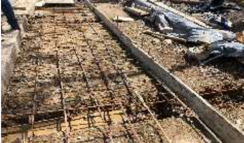
DESCRIPCION: Amarrado de formaletas