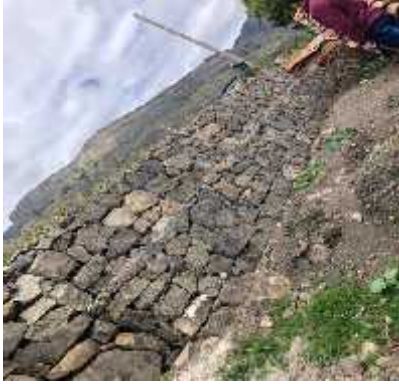
DESCRIPCION: Visita a obra