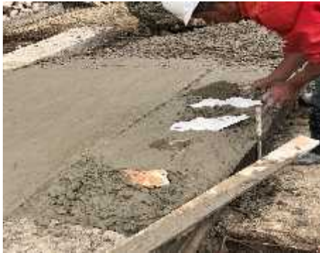
ILUSTRACION: Instalación concreto ciclópeo