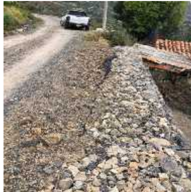
DESCRIPCION: Visita a obra