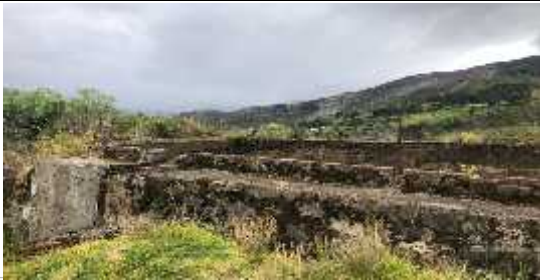
DESCRIPCION: Localización y replanteo obra