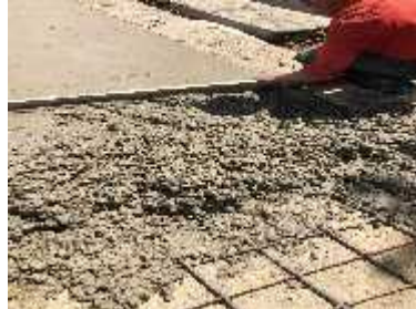
DESCRIPCION: Fundida de las huellas y vigas riostras