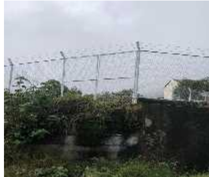
DESCRIPCION: Visita a obra

OBSERVACIONES: Se realiza vista de obra de cerramiento y realizamos labores de vigilancia y el control tecnico de las actividades de la ejecucion del contrato en el municipio de jerico boyaca: