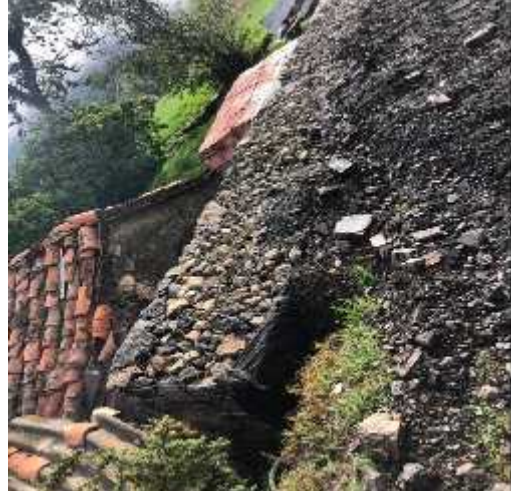
DESCRIPCION: Visita a obra