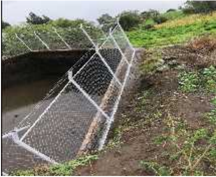
DESCRIPCION: Visita a obra