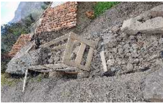
ILUSTRACION: Construccion de gaviones