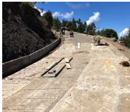
DESCRIPCION: Visita a obra

OBSERVACIONES: Se realiza vista de obra placa huella y realizamos labores de vigilancia y el control tecnico de las actividades de la ejecucion del contrato en el municipio de jerico boyaca: