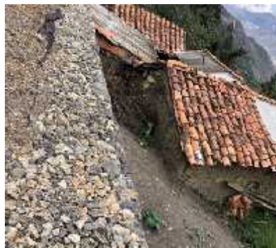
DESCRIPCION: Visita a obra

OBSERVACIONES: Se realiza vista de obra construcción de gaviones y realizamos labores de vigilancia y el control tecnico de las actividades de la ejecucion del contrato en el municipio de jerico boyaca: