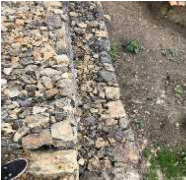
DESCRIPCION: Visita a obra