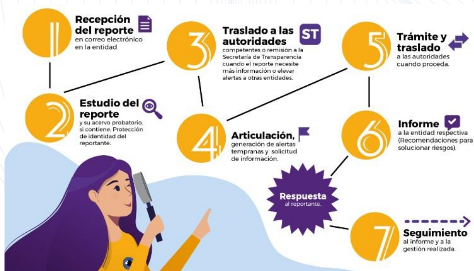
Figura numero 1 Proceso de denuncias en R.I.T.A.