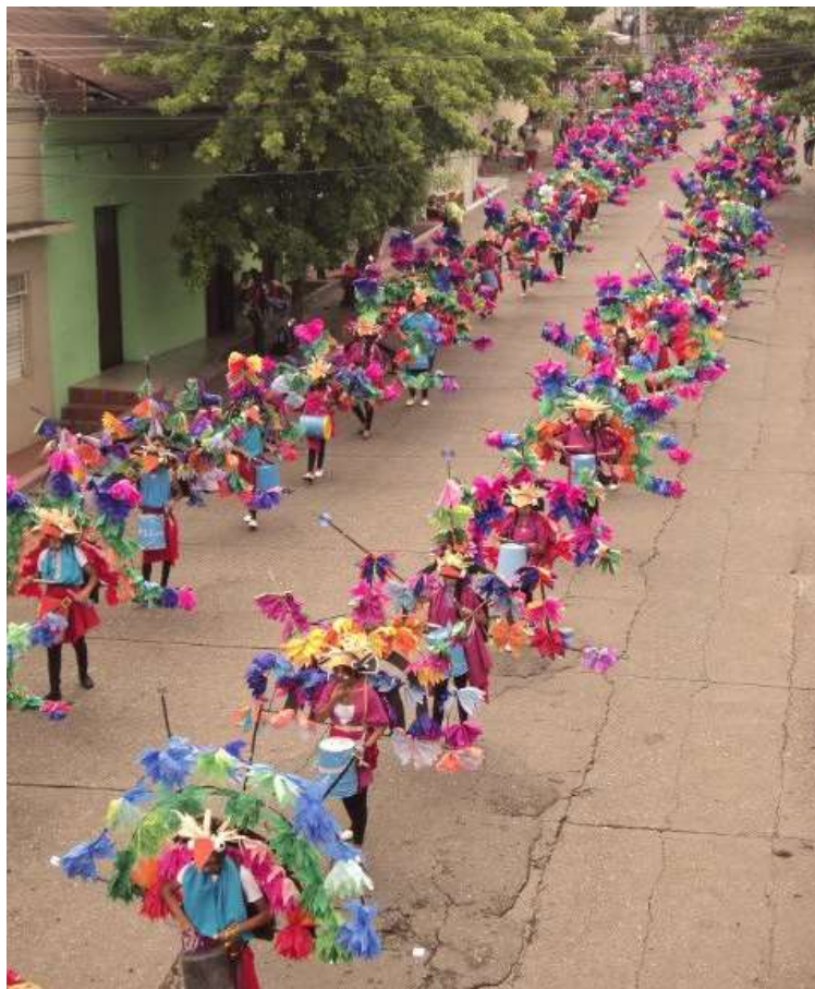
Figura 37 Estrategia Didáctica Sapo. Intervención en espacios no convencionales. Colectivo coreográfico Pacha Mama, ayer, hoy y siempre. Institución Educativa Rural Luis Antonio Duque Peña del municipio de Girardot Cundinamarca. Desfile del 9 de octubre de 2015.