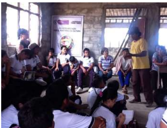
Figura 35 Plataforma Solo Parla. Acercamiento con comunidades indígenas, de la vereda Chenche Agua Fría del municipio de Coyaima- Cabildo Indígena. Institución Educativa Rural Luis Antonio Duque Peña.

2) Plataforma “ música a la caneca ” (musical); Comprende los ritmos tradicionales colombianos, ritmos binarios, ternarios, simples, compuestos y elaboración básica de instrumentos musicales tradicionales elaborados con material reciclado.