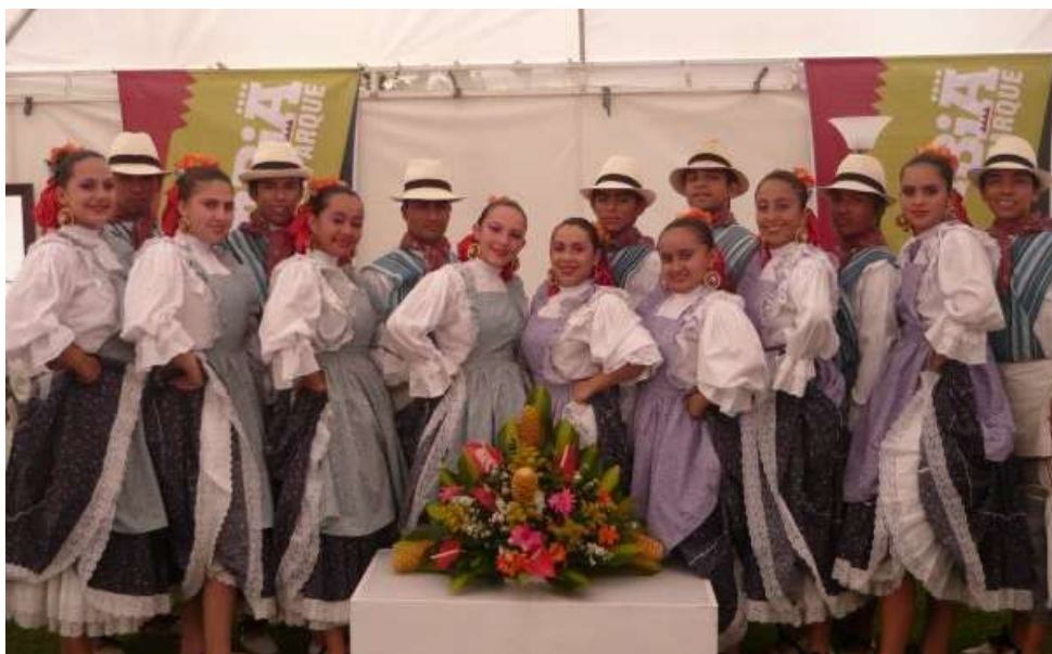
Figura 22 Colombia al Parque. Obra Son de la Montaña. FUCARE. Parque El lago Bogotá. 2010

La Fundación Artística y Cultural Encuentros FUCARE, también participó en eventos distritales, como las convocatorias de la orquesta filarmónica de Bogotá para el evento Danza al Parque, el cual la Fundación Artística y Cultural Encuentros FUCARE, bajo su dirección ganó en dos ocasiones con las obras: Son de la montaña y Sentimiento Campesino, mejor puesta en escena e investigación en las diferentes categorías a las que se presentó. Todo esto con el apoyo de las familias de los bailarines, de la junta de la acción comunal y algunos actores anónimos que facilitaron la financiación de estos procesos.