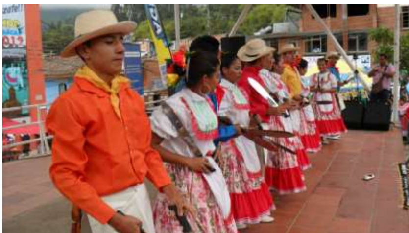
Figura 27 Festival Internacional de Danza en Pasca Cundinamarca. Fundanza, Armenia Quindío.

del Cauca, Meta, Casanare, Quindío, Antioquia, Risaralda, Atlántico, Cundinamarca y Bogotá en sus diferentes versiones. Al igual que la creación del festival nacional de música campesina, el cual ha contado con músicos exponentes de las diferentes regiones del país, en sus diferentes versiones.