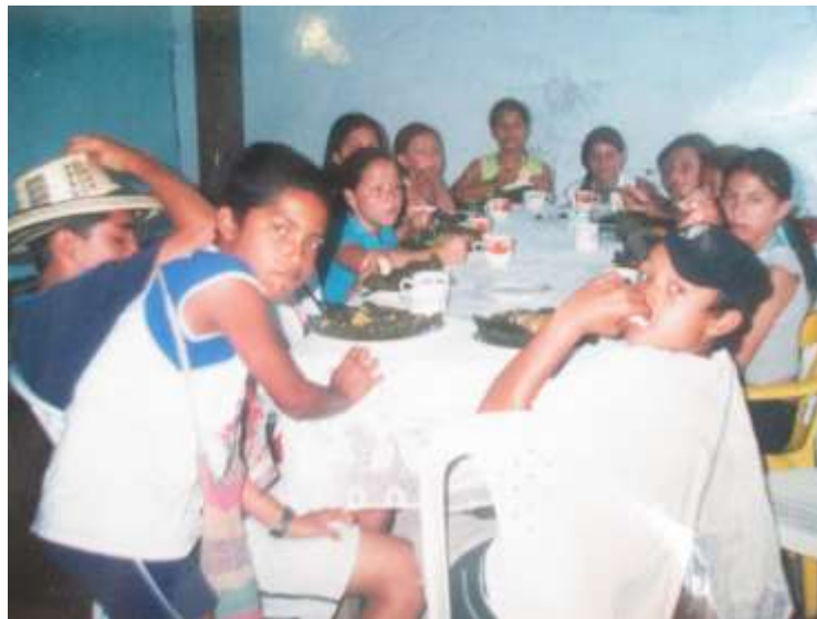
Figura 17 Festival Nacional de Danza Tradicional en Coyaima Tolima. Fuzakatan. Hora de la cena.