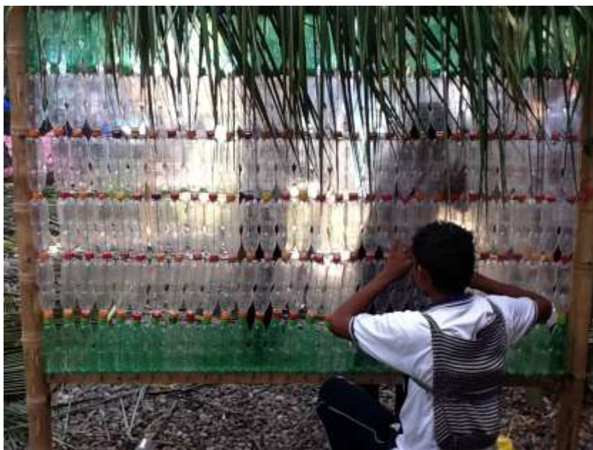
Figura 31 Creación de imaginarios colectivos. Plataforma My Arte. Institución Educativa Rural Luis Antonio Duque Peña.