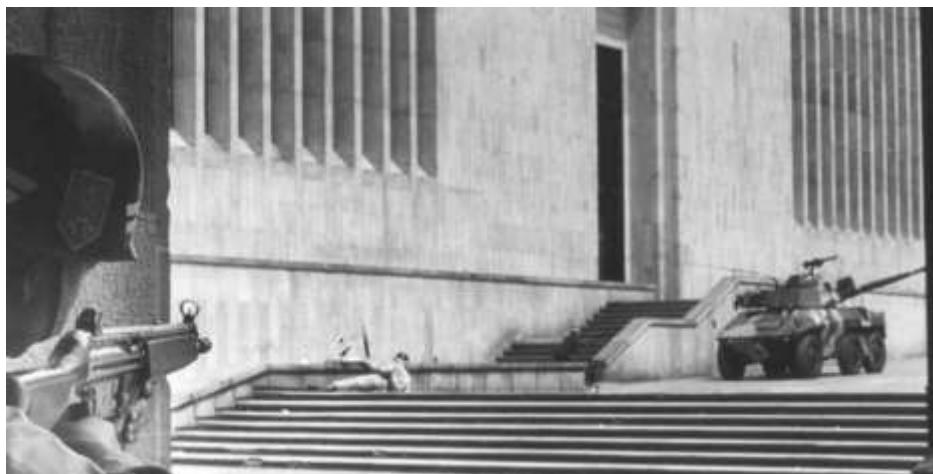
Figura 9 Toma del Palacio de Justicia por el grupo armado M-19 noviembre 6 de 1985.

Nota. Tomado de archivo ámbito judicial.com/noticias