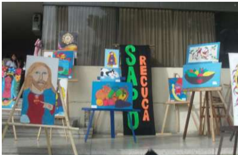
Figura 32 Participación Estrategia Didáctica SAPO. Experiencias Alternativas Pedagógicas de Girardot Cundinamarca. Institución Educativa Rural Luis Antonio Duque Peña.