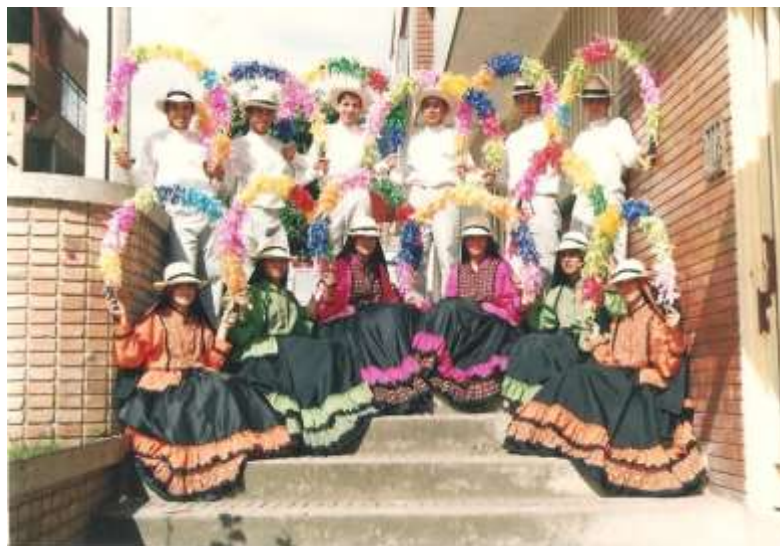
Figura 11 Fotografía. Grupo de Danzas del Colegio Instituto Santander