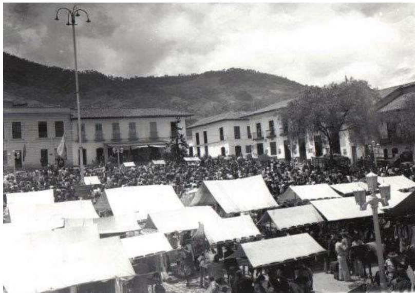
Figura 5 Fotografía. Plaza central de Fusagasugá. Toldos de venta de comida.