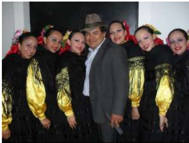
Figura 12 Fotografía. Gala de ganadores del Festival Danza en la Ciudad en el Teatro Jorge Eliecer Gaitán.