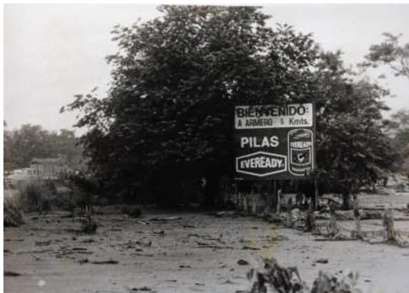
Figura 10 La Avalancha de Armero. Noviembre 13 de 1985.