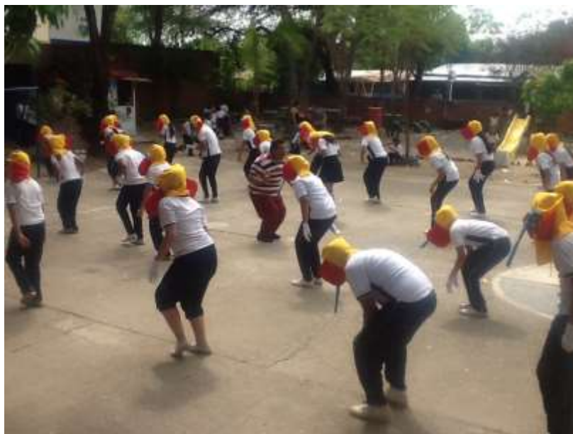
Figura 29 Institución Educativa Rural Luis Antonio Duque Peña. Clase de educación artística y cultural