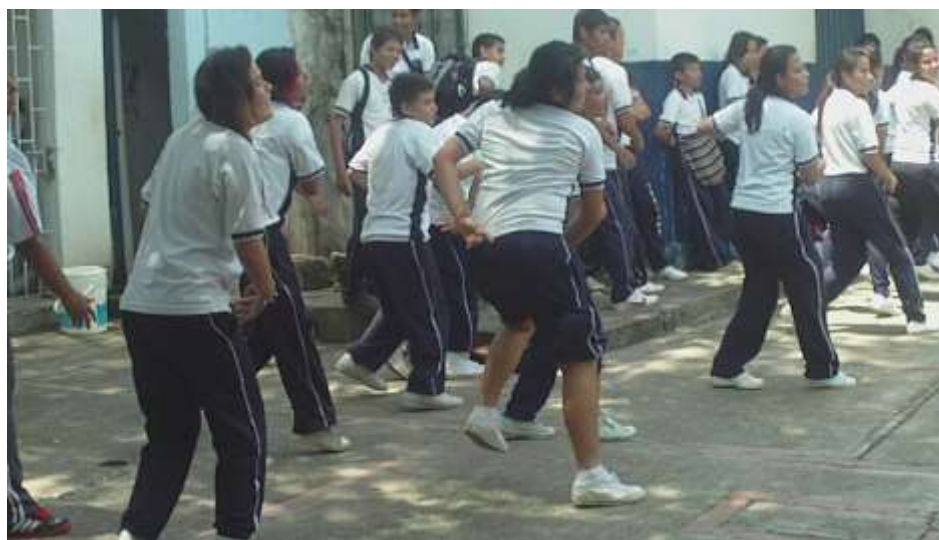
Figura 33 Plataforma Color en movimiento. Institución Educativa Rural Luis Antonio Duque Peña de Girardot.

Para alcanzar estos propósitos, la propuesta se ha diseñado a partir de plataformas disciplinares que responden a los cuatro fenómenos culturales que conforman el saber popular, expuestos por Guillermo Abadía Morales en el compendio general del folklore: