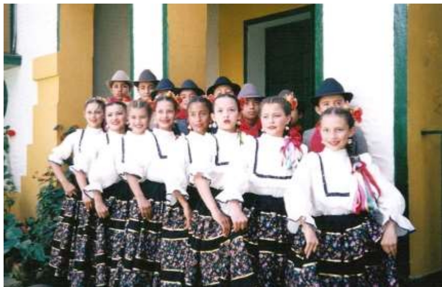
Figura 14 Centro de Formación Artística y Cultural Fuzakatan.