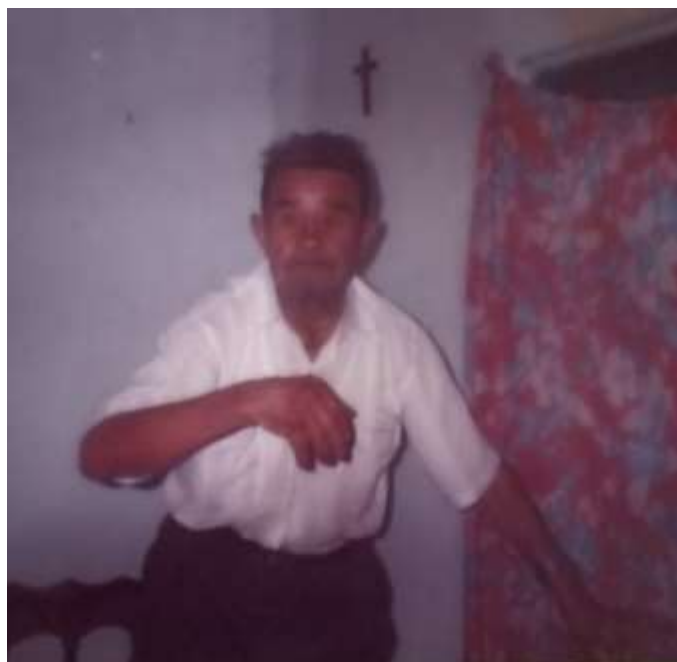
Nota.