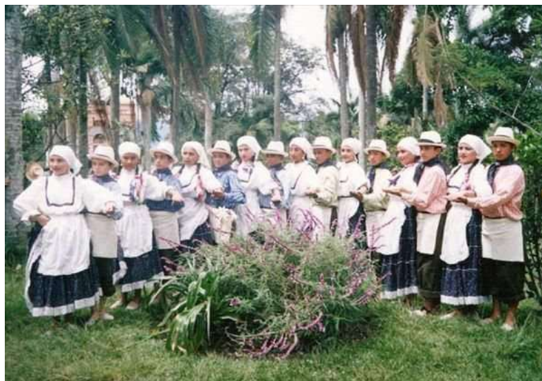
Figura 16 Fotografía. Centro Artístico y Cultural Fuzakatan. Hacienda el Molino