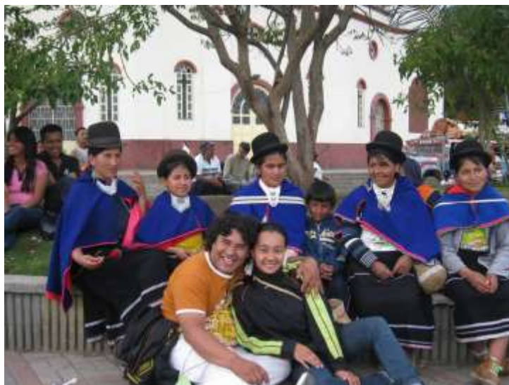
Figura 19 Fotografía. Festival Nacional de Danzas en Guambia. Silvia Cauca.