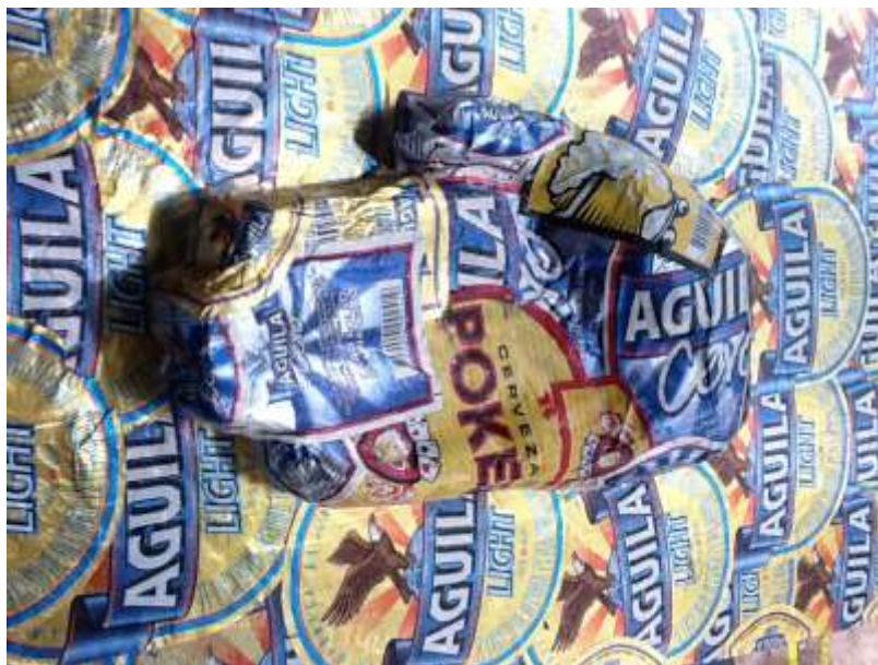
Figura 36 Plataforma My Arte. Manos arriba. Institución Educativa Rural Luis Antonio Duque Peña.

3) Plataforma “ solo parla ” (literario): Proceso de transmisión oral de los hechos cotidianos del saber popular, de la tradición de nuestras familias.