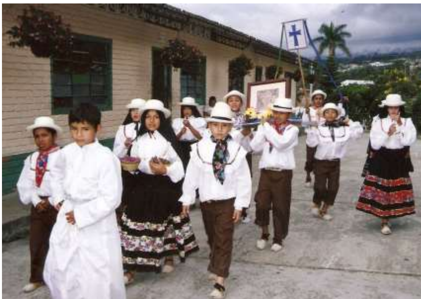
Figura 13 Grupo de Danzas de la Escuela Fusacatan del municipio de Fusagasugá.