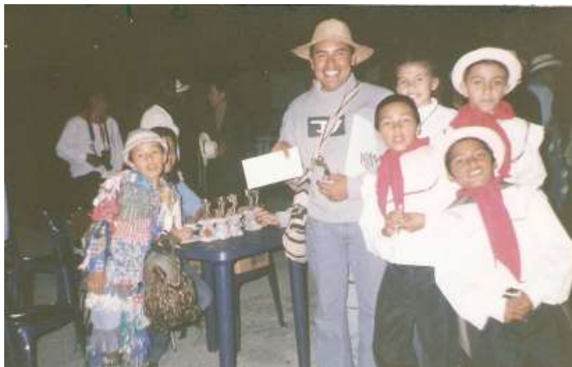
Figura 15 Participación Fuzakatan en el Festival Concurso de Danza Andina Sal y Cultura en el Municipio de Nemocón Cundinamarca