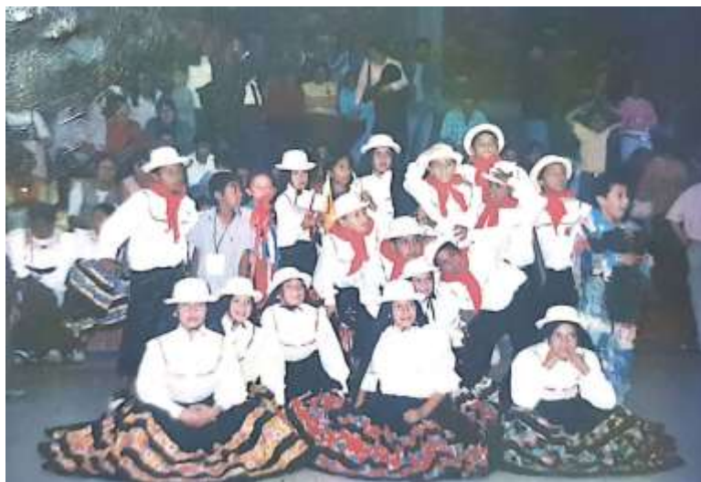
Figura 18 Fotografía. Fuzakatan, participación en el Festival Concurso Departamental de Danza Folclórica Andina en Nemocón Cundinamarca

Como director del CEFAC, Fuzakatan viajó a muchos lugares de Colombia, reconoció culturas del país, participó en diversos concursos, festivales, encuentros, siempre destacándose por una responsable y respetuosa participación.