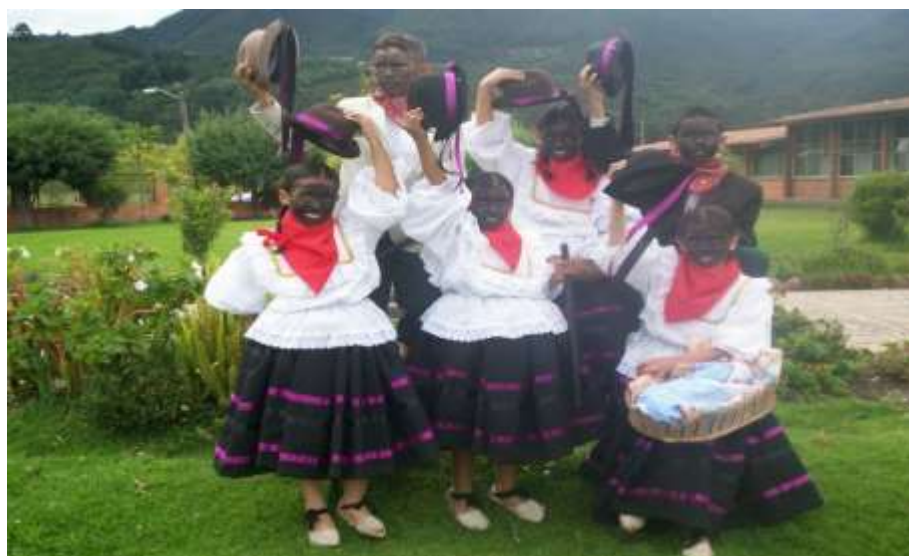
Nota. Archivo personal.

Iniciaron siendo un grupo de niños sin mucho conocimiento de la danza, pero terminaron siendo un colectivo bien conformado. En cuanto a la técnica, no se trabajó mucho en ese aspecto, porque se pretendía respetar el movimiento particular de cada integrante, para no perder la esencia y la sustancia de las danzas de Pasca; allí se dio una forma diferente que fue reconocer el movimiento como elemento individual de cada persona, no queriendo hacer una coordinación entre las formas de movimiento, pero si en las estructuras coreográficas y esto los llevó a crear