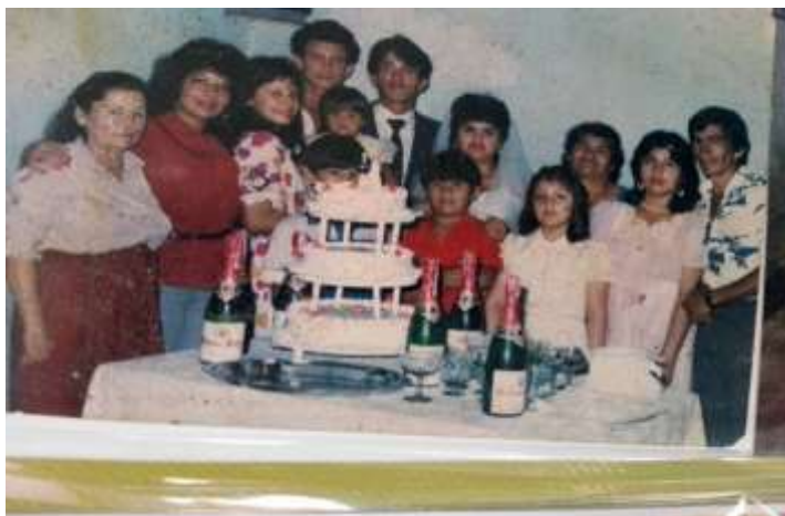
Figura 8 Fotografía. Celebración familiar Boda