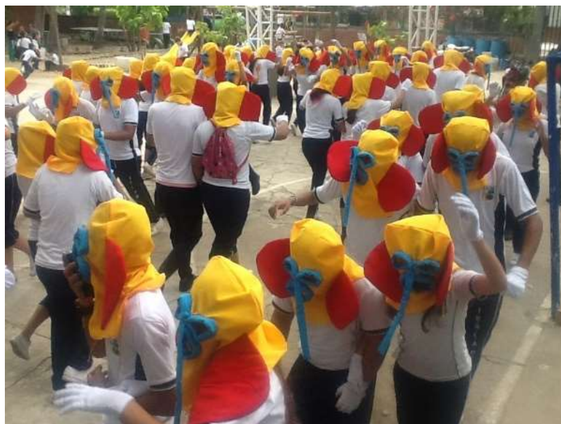
Figura 39 Estrategia Didáctica Sapo. Intervención en espacios no convencionales. Colectivo coreográfico Paragüitas, Un legado que vive. Institución Educativa Rural Luis Antonio Duque Peña del municipio de Girardot Cundinamarca. Desfile del 9 de octubre de 2018.