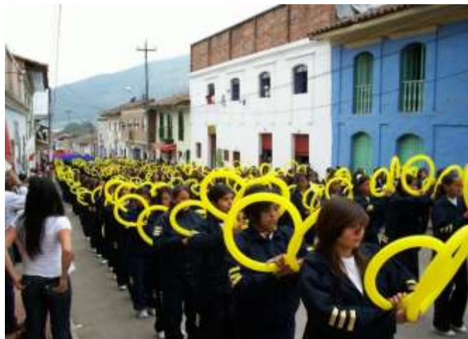
Figura 30 Fotografía. Desfile de la Escuela Normal Superior Nuestra Señora de la Encarnación en el Municipio de Pasca Cundinamarca.