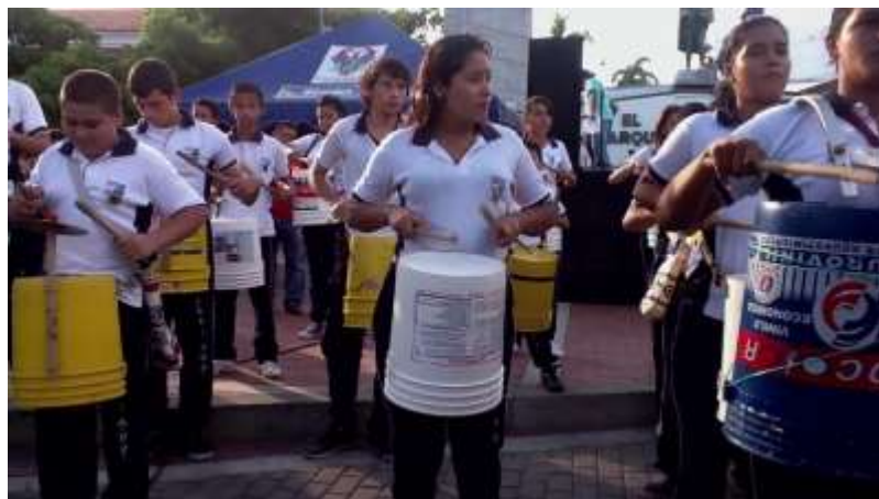
Figura 34 Plataforma Música a la caneca. Institución Educativa Rural Luis Antonio Duque Peña de Girardot