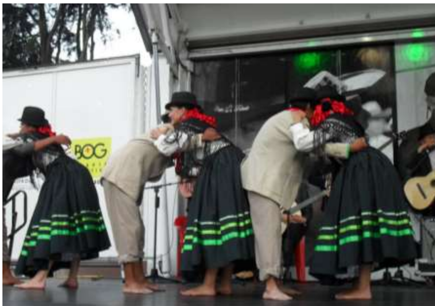
Figura 23 Colombia al Parque. Obra Sentimiento Campesino. FUCARE. Parque El lago Bogotá. 2011