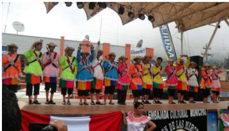
Figura 28 Festival Internacional de Danza en Pasca Cundinamarca. Compañía Nacional de Danzas de la embajada cultural de Paita Perú.