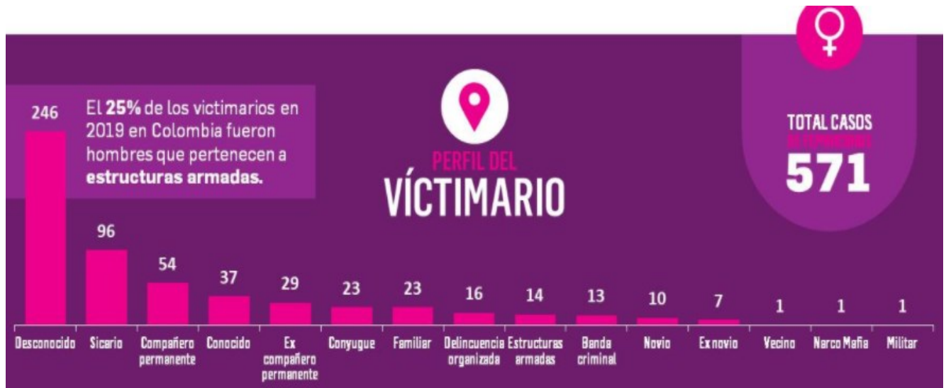
Figura 3. Perfil del victimario

Nota. Perfil detallado del victimario que cometió el feminicidio representado de forma numérica en el 2019. Fuente: Adaptado de (Observatorio Feminicidios Colombia, 2020).