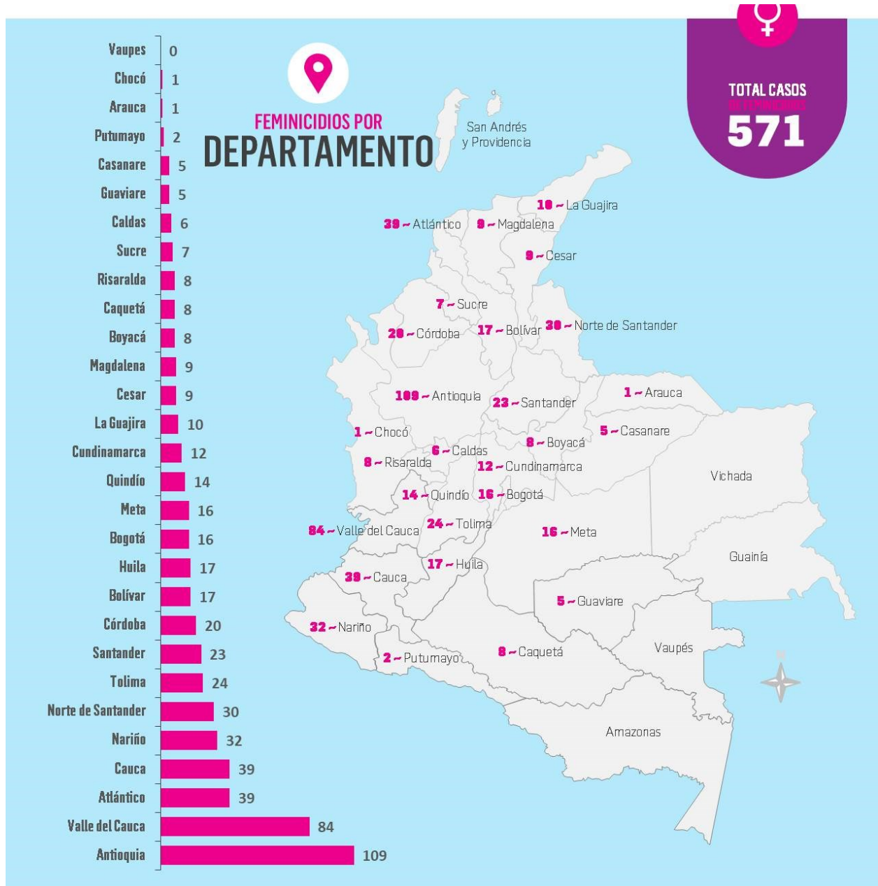
Figura 2. Femicidio en Colombia en 2019

Nota. Mapa de distribución numérica de femicidio ocurridos para el año 2019, expresado por departamento.