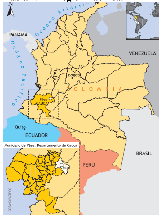
Tabla N° 7: Región Pacifica.